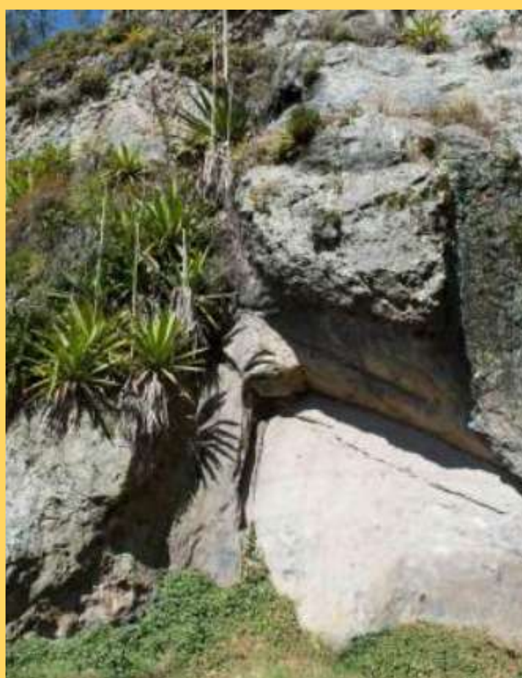
PIEDRA DE LA SERPIENTE

Recorrido tranquilo, accesible, guiado por sabedores locales, los visitantes conocerán sitios sagrados, espacios de organización tradicional y prácticas espirituales propias del resguardo. Durante la jornada se comparten relatos, memorias y significados culturales que enriquecen la comprensión del territorio.